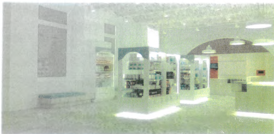
Idejno rješenje Apoteke Stari Grad

Pored navedenog, u prvom kvartalu 2018. godine planira se djelimična adaptacija objekta Čengić vila na adresi Bulevar Meše Selimovića 21, na način da će se sanirati krov koji već duži niz godina prokišnjava, čeona fasada, rampa za pristup invalida, te dva odvojena specijalizovana prodajna prostora, i to: